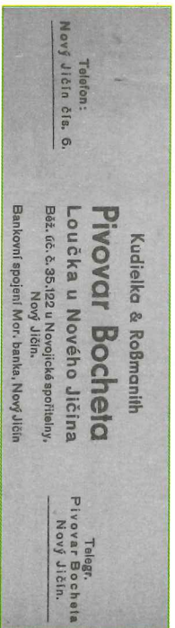
Titulní list havíčkového papíru pivovaru Bocheteta.