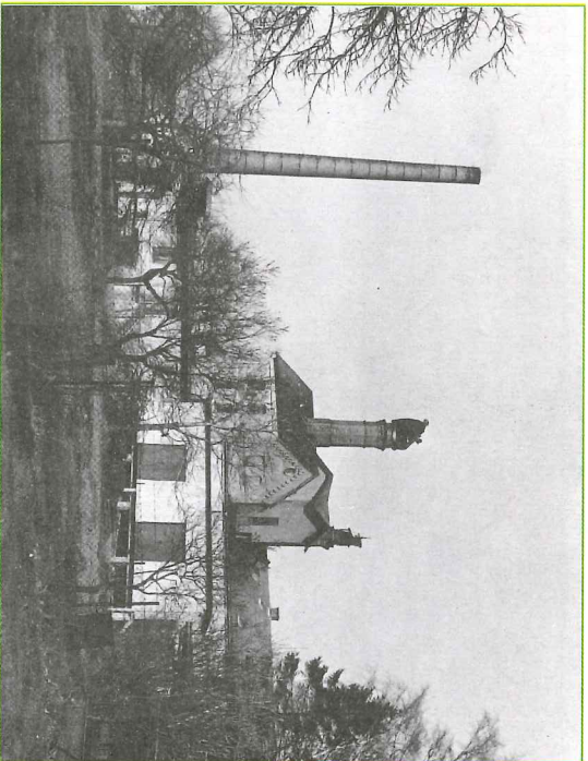
Snímek pivovaru z padesátých let minulého století.